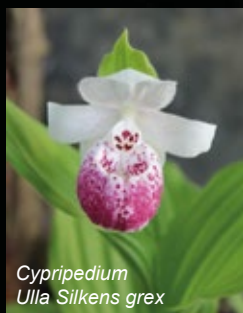
Cypripedium Ulla Silkens grex