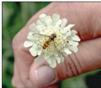
Blomfluga besöker en Scabiosa ochroleuca gulvädd.