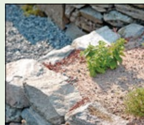
Nyplanterade småplantor. Så här ser det ut innan ytan täcks med grövre grus.