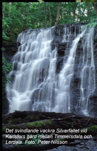
Det svindlande vackra Silverfallet vid Karlsfors gård mellan Timmersdala och Lerdala.